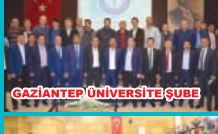
GAZİANTEP ÜNİVERSİTE ŞUBE