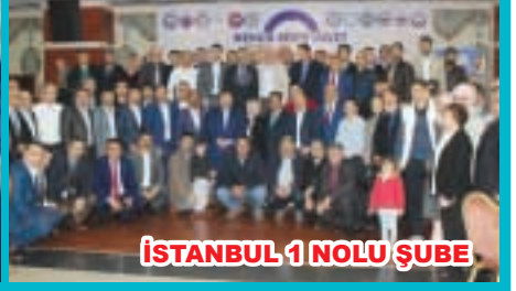
İSTANBUL 1 NOLU ŞUBE