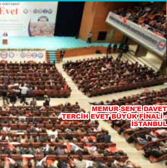
MEMUR-SEN'E DAVET TERCİH EVET BÜYÜK FİNALİ - İSTANBUL