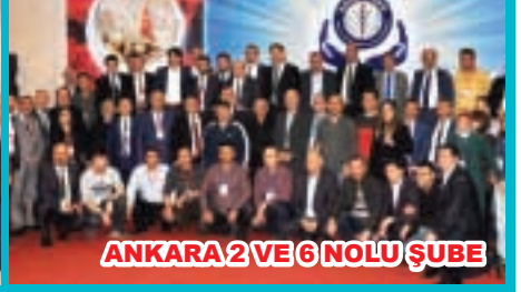
ANKARA 2 VE 6 NOLU ŞUBE