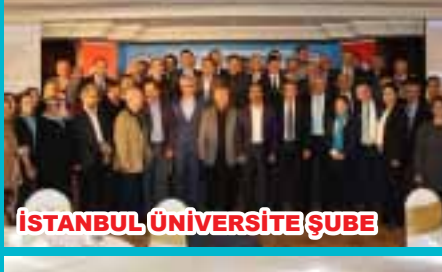
İSTANBUL ÜNİVERSİTE ŞUBE