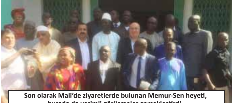
Son olarak Mali'de ziyaretlerde bulunan Memur-Sen heyeti, burada da verimli görüşmeler gerçekleştirdi.

Mali CSTM Konfederasyonu Genel Başkanı Hamamdoun Amion Gyindo ve yönetimi ile bir araya gelen Memur-Sen heyeti, UNTM Konfederasyonu Genel Başkanı Yacouba Kati ve yönetimi ile bir araya geldi.