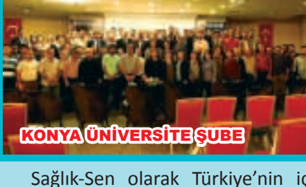
KONYA ÜNİVERSİTE ŞUBE