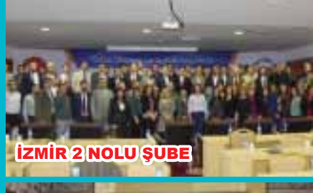
İZMİR 2 NOLU ŞUBE