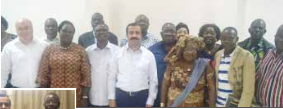
Burkina Faso'da sağlık merkezi ziyaret eden Memur-Sen heyet, Burkina Faso Memuriyet, Çalışma ve Sosyal Güvenlik Bakanı Clement Savadogo ile görüştü.