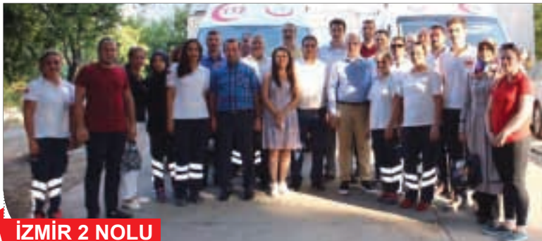
İZMİR 2 NOLU