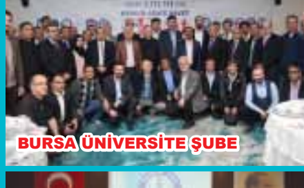
BURSA ÜNİVERSİTE ŞUBE