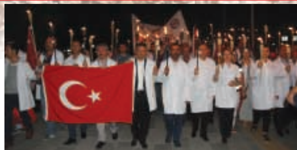
15 Temmuz'da Beyaz Yürüyüş