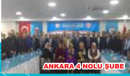
ANKARA 4 NOLU ŞUBE