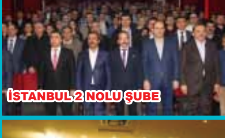
İSTANBUL 2 NOLU ŞUBE