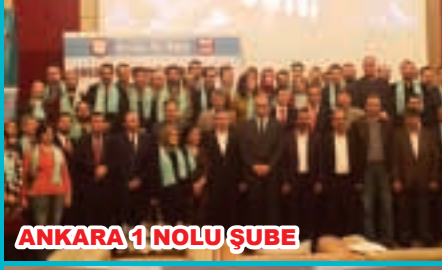
ANKARA 1 NOLU ŞUBE